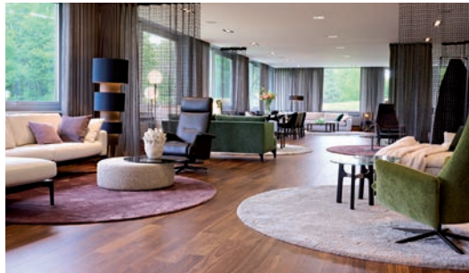
BW BIELEFELDER WERKSTÄTTEN Potsdamer Straße 180, 33719 Bielefeld

Besuchen Sie uns in unseren Showrooms: Come visit our showrooms