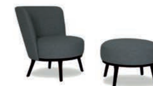
Polo Cocktail Sessel / Polo Cocktail chair