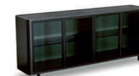
Allure / Allure