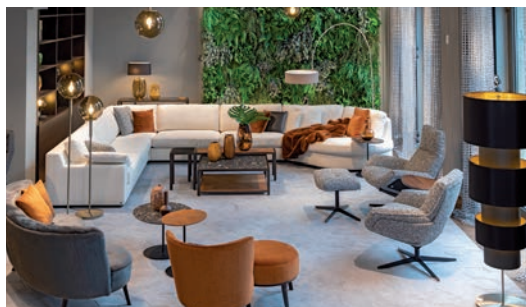
JAB ANSTOETZ GROUP Knesebeckstraße 61, 10719 Berlin