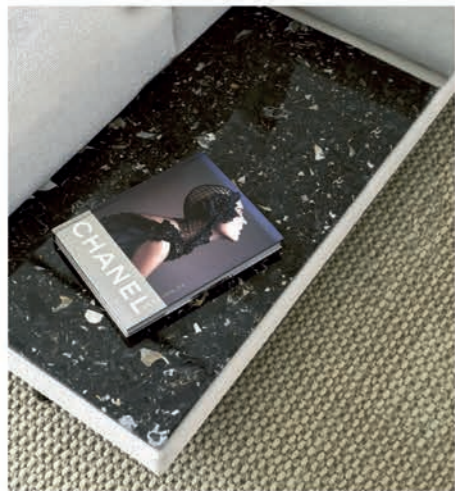
Tischelement Terrazzo / table element terrazzo

As practical accessories, LONG ISLAND offers table elements made of exciting materials coordinated to the COMPLEMENTS series table models that can be used in many different ways – as a finishing element or intermediate addition in seating combinations, or as a classic side table. The tall edge that acts like a tray to catch a spilled drink, is a particularly clever touch.