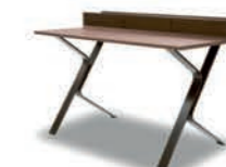
Supreme / Supreme