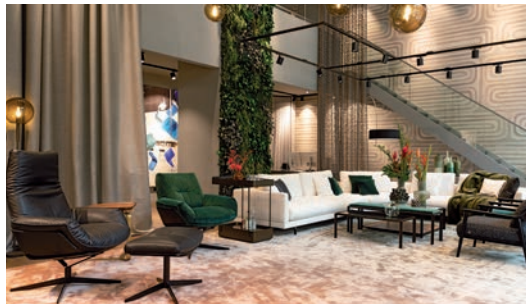
JAB ANSTOETZ GROUP Unterer Anger 3, 80331 München