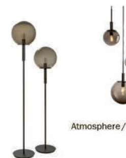
Atmosphere / Atmosphere