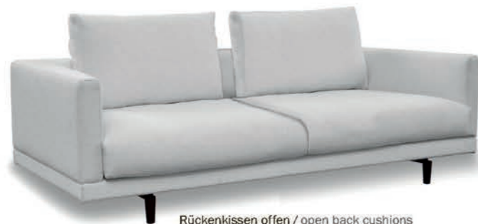
Rückenkissen offen / open back cushions Sitzkissen geteilt / divided seat cushions

Because every person is different, LONG ISLAND offers two variants of seat cushions as well: as a one-piece surface area, or separate individual areas. The two backrest options offer even more design freedom. Customers can choose between open and closed cushions.