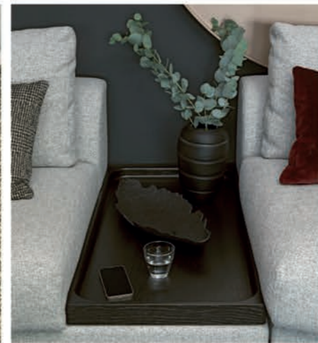
Tischelement Esche / table element ash