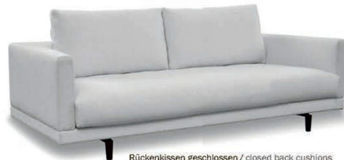
Rückenkissen geschlossen / closed back cushions Sitzkissen einteilig / one-piece seat cushions